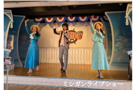
ミシガンライブショー