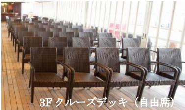
3F クルーズデッキ (自由席)

クルーズデッキ前方のステージでは、 ミシガンパーサーによる楽しい 観光案内やライブショーが 繰り広げられます! (見学自由)