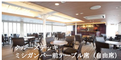
クルーズデッキ ミシガンバー前テーブル席 (自由席)