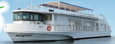
就航船 megumi ※船は変更になる場合がございます。

2026年 5/10日～ 11/15日の 特定日運航 最少催行人員20名様 予約制