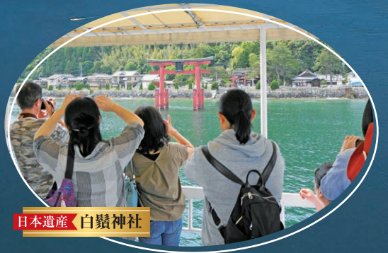
日本遺産 白鬚神社