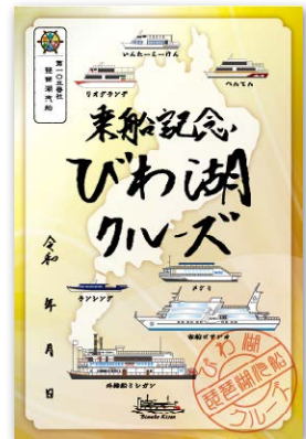
4 3港コンプリート限定 びわ湖クルーズデザイン