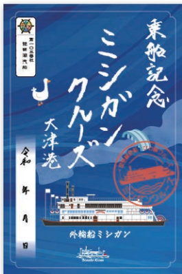
1 大津港限定 ミシガンクルーズデザイン