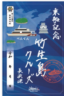
3 長浜港限定 竹生島クルーズデザイン