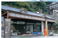
売店 船着場から宝蔵寺へ向かう途中にお土産物のお店があります。びわ湖特産の魚や貝の佃煮や竹生島名物が並んでいます。