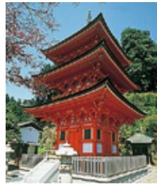
宝蔵寺 三重塔 江戸時代初頭に落雷で消失したといわれている三重塔は「浅井郡誌」に基づき2000年に再建された建物です。

724年に行基が開いたお寺。 西国三十三所観音霊場・第三十番札所 で、御本尊は日本三弁才天のひとつであ る弁才天(大弁才天)と千手観音です。