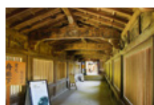
宝蔵寺 舟廊下(重文) 舟廊下は、豊臣秀吉の御座船「日本丸」の船槽を利用して建てたと伝えられています。(幅約1.8m、長さ約30m)