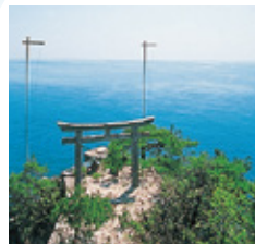
龍神拝所 拝所からびわ湖に向かう鳥居へかわらけを投げ鳥居の間を通ると願いが叶うといわれています。

神社名は「つくぶすま」。竹生島の古名だといわれています。 平安時代の延喜式に載る由緒ある神社です。