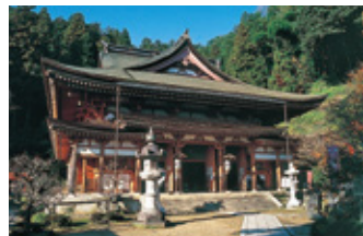
宝蔵寺 本堂(弁才天堂) 弁才天が安置されている本堂。堂内壁面の「諸天神の図」「飛天の図」は必見です。