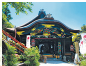
宝蔵寺 唐門(国宝)・観音堂(重文) 唐門は、秀吉が建てた大坂城の極楽橋の一部で、現存唯一の大坂城遺構。唐破風は桃山時代を象徴する造りです。観音堂には、千手観音が安置されています。