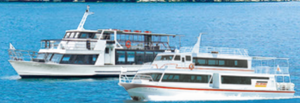
※画像はすべてイメージです。