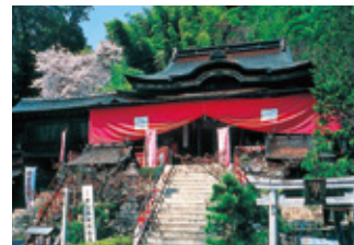
都久夫須麻神社 本殿(国宝) 建物は伏見城の遺構と伝えられています。本殿内正面の棧唐戸(さんからど)にはめ込まれた菊や牡丹、鳳凰の彫刻がきれいです。