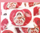
ねがいだるま 優しい味わいのミルクまんじゅうは巡礼の旅にぴったり。