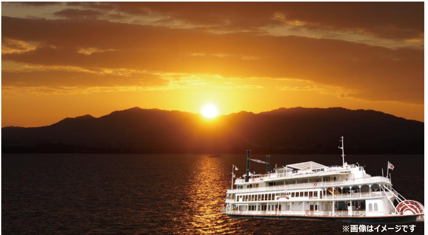
※画像はイメージです

琵琶湖汽船株式会社（本社：滋賀県大津市浜大津、社長：川添智史）は、2024年1月1日（月・祝）限定でミシガン初日の出クルーズを特別運航いたします。