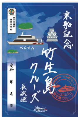
3 長浜港限定 竹生島クルーズデザイン