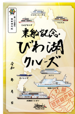
4 3港コンプリート限定 びわ湖クルーズデザイン