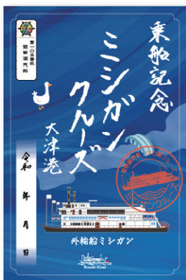
1 大津港限定 ミシガンクルーズデザイン