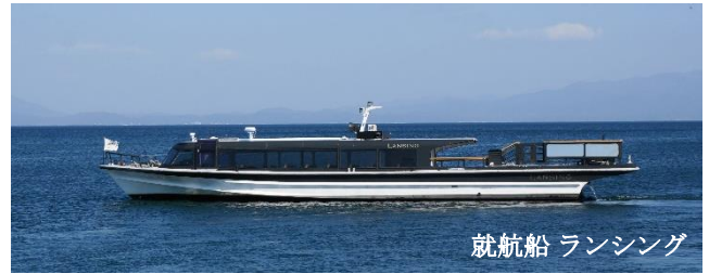
就航船 ランシング