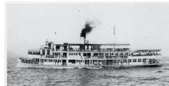
竹生島めぐり「みどり丸」