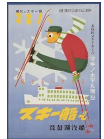
「スキー船」のポスター