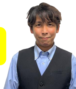
※観光ガイド（イメージ）