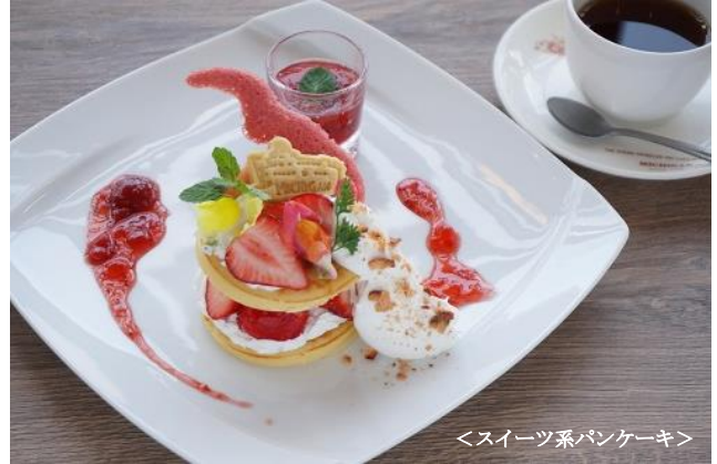
<スイーツ系パンケーキ>

パンケーキ 日野町産のいちごジャム フレッシュフルーツ（いちご） 紅茶（朝宮茶和紅茶） or コーヒー or ソフトドリンク