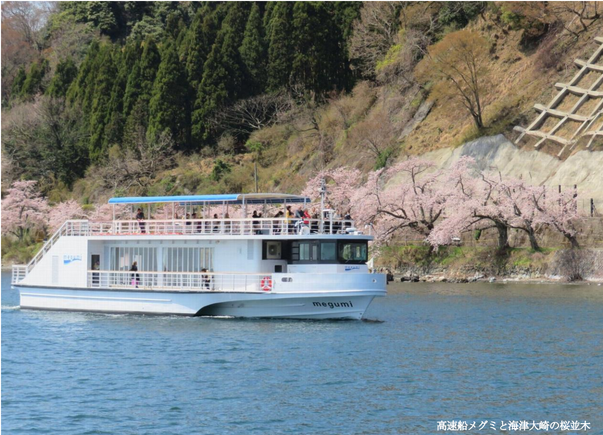
高速船メグミと海津大崎の桜並木