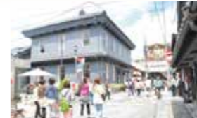
●从长滨港步行约15分钟