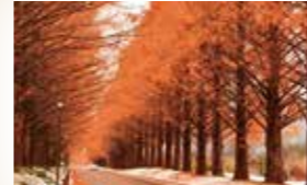
●从今津港乘车约15分钟