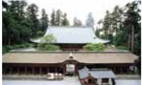
●从天津港乘车约30分钟