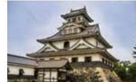
●从长滨港步行约12分钟