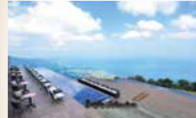
●从天津港乘车约70分钟