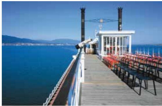
顶层甲板可以360°环顾琵琶湖全景。欢迎欣赏这美不胜收的琵琶湖风光。

红色“船桨”就是象征！琵琶湖的代表性娱乐观光船。 密西根号起航于1982年4月29日，是琵琶湖最具代表性的大型游览船。 为祈愿滋贺县与结有姐妹友好关系的美国密西根州之间的国际友谊长久而命名。 作为特色十足的明轮船，自起航以来始终大受欢迎。