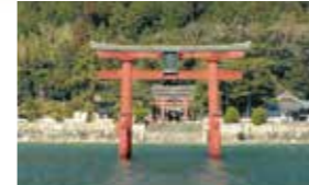
●从今津港乘车约20分钟