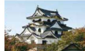
●从彦根站步行约10分钟