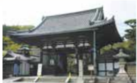
●从天津港乘车约20分钟