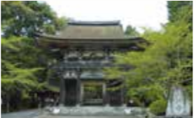
●从天津港乘车约5分钟