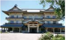
●从柳崎湖畔公园港步行约1分钟